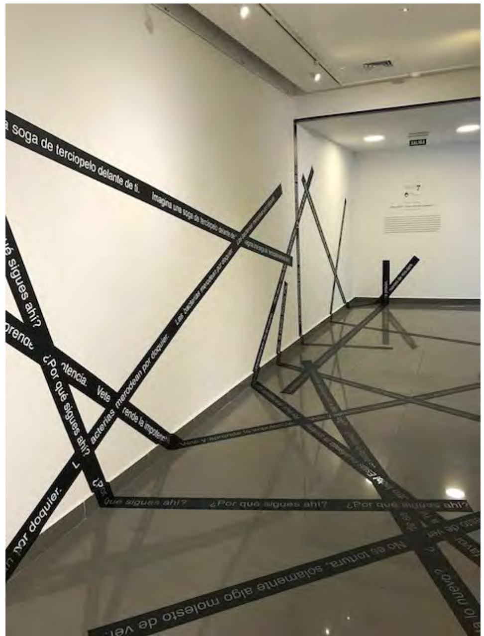
Luis Camnitzer , Please Look Away , 2015. Vista de la exposición en Sala de Arte de la Fundación Minera Escondida de Antofagasta. © Luis Camnitzer/Artists Rights Society (ARS), New York

hegemonía occidental. Mirando la obra una y otra vez no puedo dejar de pensar que su importancia probablemente no esté en el aspecto artístico. Está en que gracias a diversos tipos de publicidad la obra se ha convertido en una pantalla sobre la cual proyectamos nuestros repudios al fascismo. La calidad de ícono o de símbolo no fue manufacturada por Picasso (tiene cuadros infinitamente mejores, e incluso los croquis preparatorios me parecen más fuertes que esa pintura) sino por nosotros como co-autores de la obra, que la completamos con nuestra proyección. Pero esto no quita que como artistas también somos ciudadanos, y como buenos ciudadanos nuestra misión es resistir. Y como buenos ciudadanos artistas tenemos que actuar asumiendo que nuestra resistencia y nuestras opiniones cuentan en ayudar al apoyo de ciertos valores y a la mejoría de la humanidad. Así que el hacer arte tenemos que tomar en cuenta esas y muchas otras cosas. Pero siempre hay que hacerlo sin permitir que el ego megalómano predomine en la tarea. La contribución es la misma