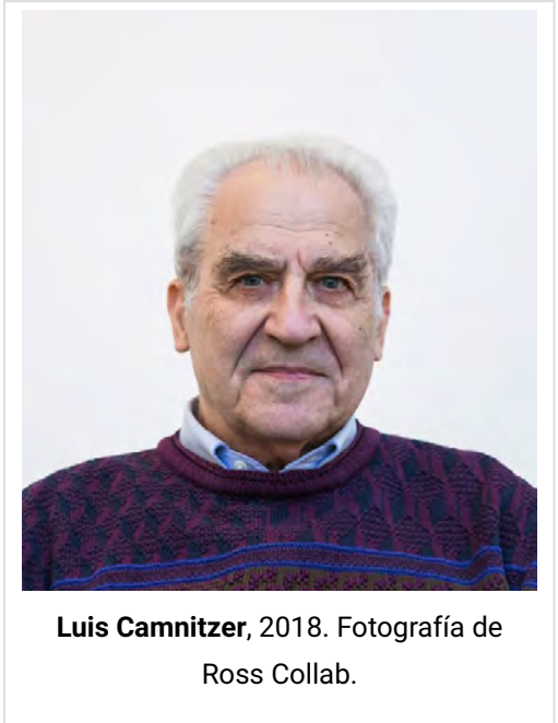
Luis Camnitzer, 2018.

LC: Creo que eso de norte/sur y este/oeste ya no funciona con la misma simpleza de antes. Para mí el centro/periferia es un problema de información y no de geografía y que hoy nos movemos en un mundo infográfico y no geográfico. La consecuencia es que el esquema centro/periferia pasó a funcionar como si fuera una emulsión. La imagen apropiada ya no es el mapa sino la mayonesa. Yo puedo ser el centro o la periferia y la persona al lado mío la periferia o el centro y estamos como en glóbulos en una suspensión. Los procesos