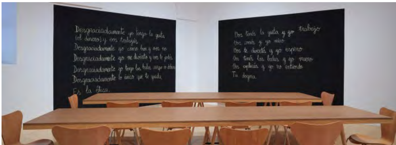
Luis Camnitzer, Aula , 2005. Museo Nacional Centro de Arte Reina Sofía, 2018.